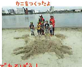
カニをつくったよ