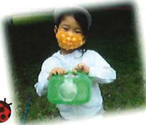
むしがすきなこ あつまれ〜!!