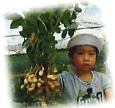
おおつぶの らっかせいが とれました!!!

「らっかせい」どんなところでそだてられているかな？ おやつは ゆでたらっかせい！ とれたてらっかせいはおいしいよ！